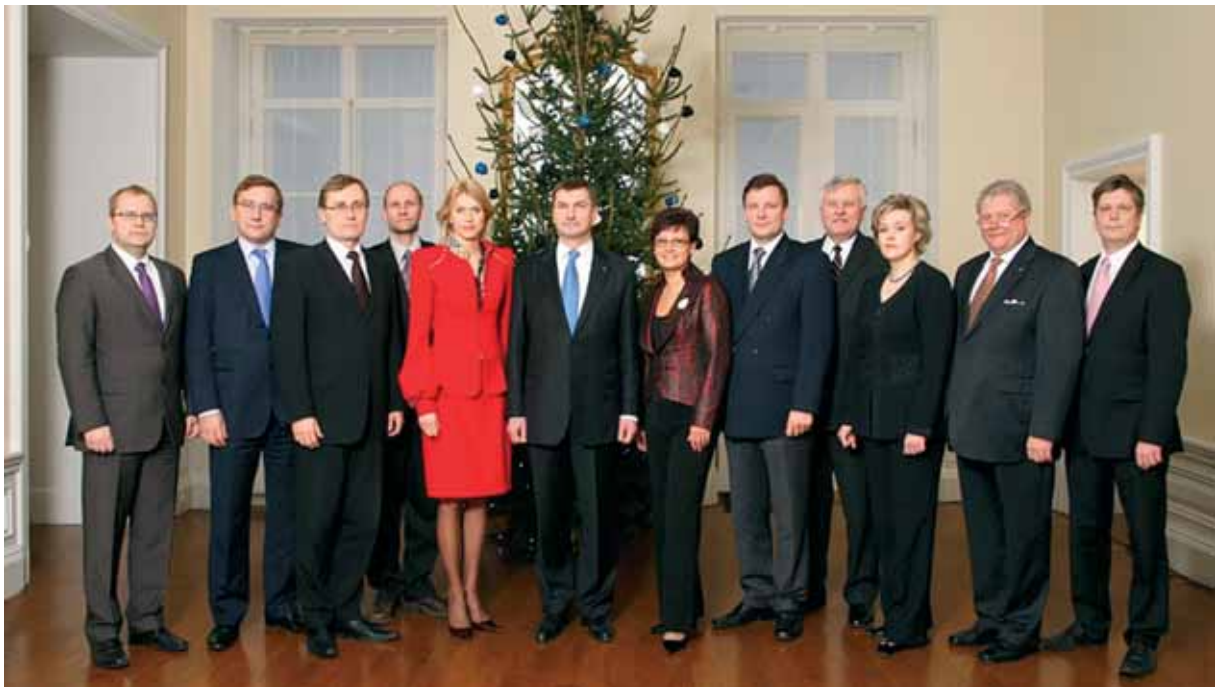
Vabariigi Valitsuse liikmed Stenbocki majas 18. detsembril 2008

tempo ja enamike eesmärkide täitmist peegeldavate näitajate trend oli positiivne. Täielikult või osaliselt oli täidetud 64 protsenti kõikidest valitsuse tegevusprogrammi eesmärkidest või tegevustest (321-st 205).