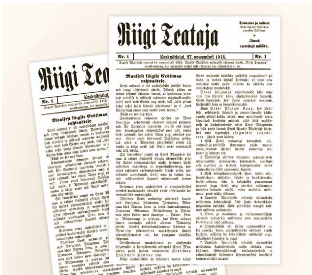
Riigi Teatajal täitus 90 aastat. Riigi Teataja nr 1, milles avaldati Eesti Vabariigi sünnidokumendid, ilmus 27. novembril 1918

Eesti Vabariigi juubeliaasta jooksul avaldati Riigi Teatajas elektrooniliselt üle neljakümne Eesti riikluse rajamist kajastava dokumendi, sealhulgas Maanõukogu otsus kõrgemast võimust, 1918. aasta Riigi Teataja väljaanded ning Tartu rahuleping.