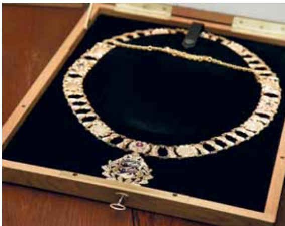
Eesti kõrgeim autasu – riigivapi ketiklassi teenetemärk

Vabariigi aastapäeva eel valmistas Riigikantselei Eesti kõrgeima autasu – riigivapi ketiklassi teenetemärgi. Riigikogus