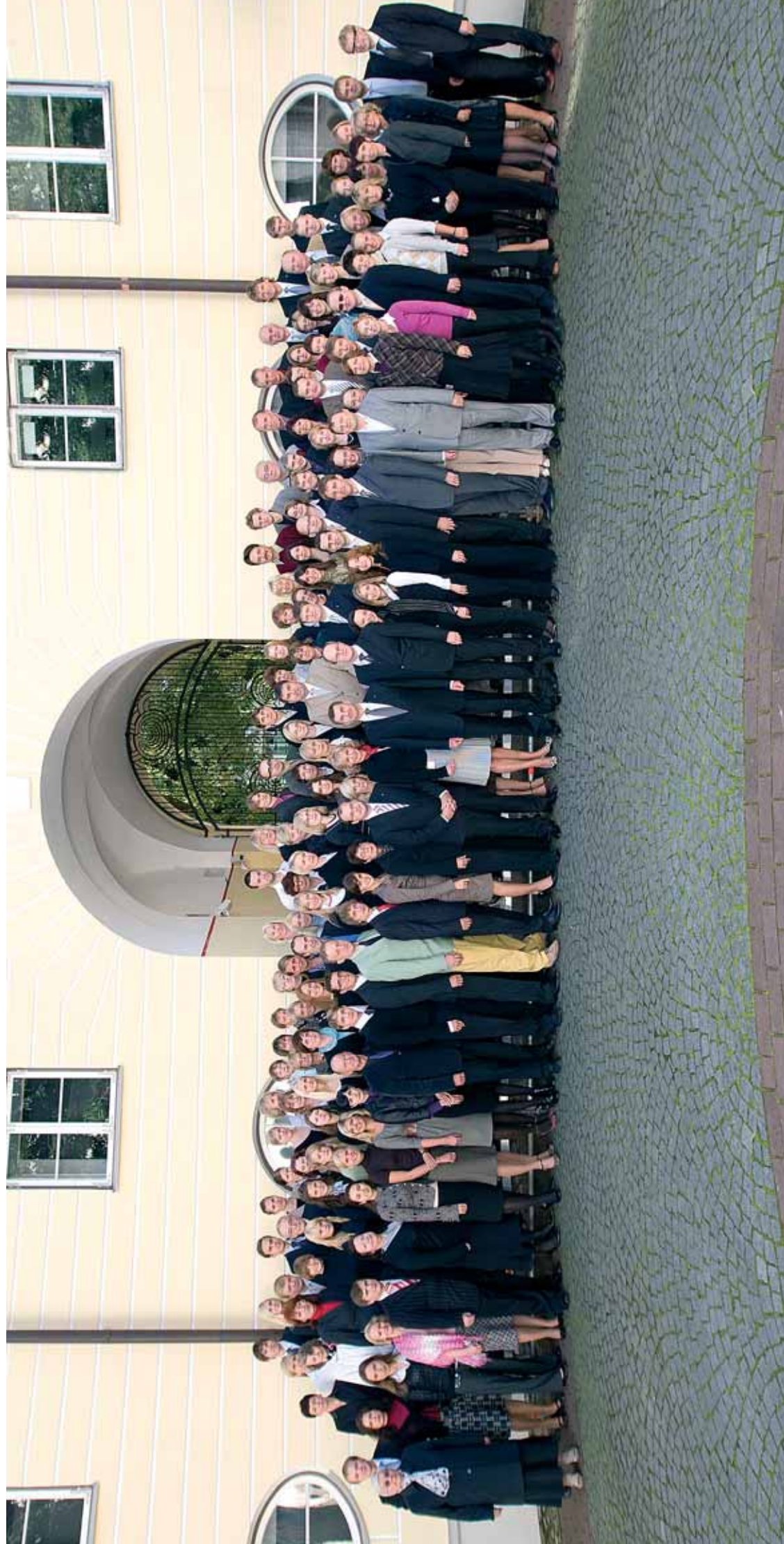
Riigikantsselei töötajad koos peaministriiga Stenbocki maja hoovis 25. septembril 2008