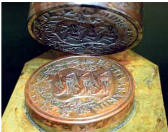
Ajaloolise riigipitsati pressvormid Stenbocki majas