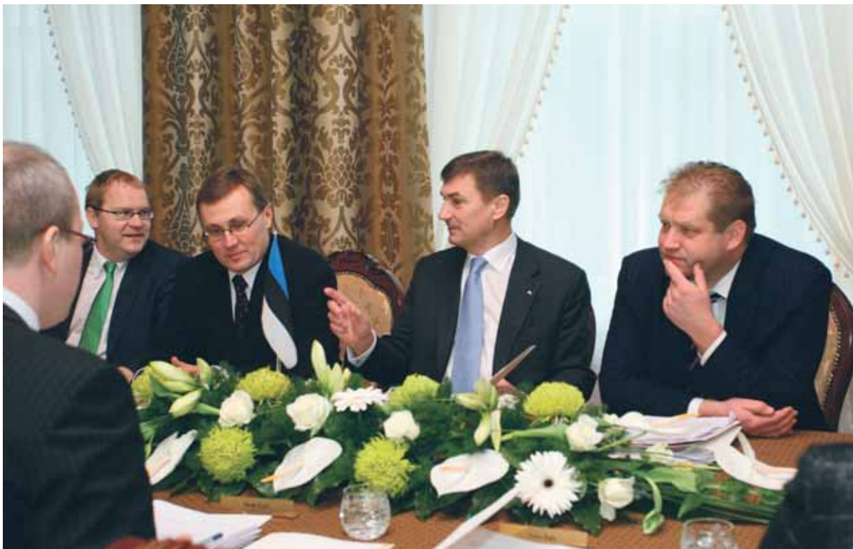
Valitsuse väljasõiduistung 11. novembril 2008 Raekoja plats 14 hoones, kus 90 aasta eest resideerus Ajutine Valitsus. Novembris 1918 alustasid seal tegevust Riigikantselei ning teised valitsusasutused

Juubeliaastal oli kaks tippetke: Eesti Vabariigi aastapäeva tähistamine 23. veebruaril Pärnus ja 24. veebruaril Tallinas ning Eesti taasiseseisvumisele kaasa aidanud laulvast revolutsioonist 20 aasta möödumist tähistav ülerahvaline öölaulupidu “Märkamisaeg” 19. augustil.