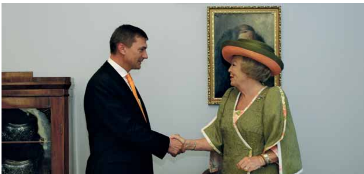
Peaminister Andrus Ansip Madalmaade kuninganna Beatrix'iga Stenbocki majas 14. mail 2008

sekretär Pariisis Matignon'is esmakordselt Prantsuse valitsuse peasekretäriaga.