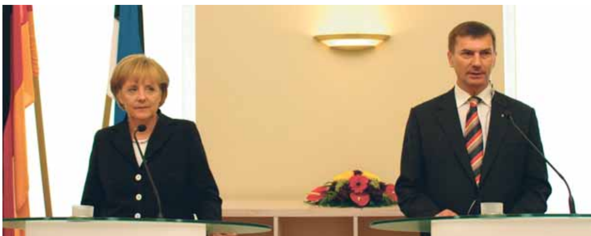
Saksamaa liidukantsler Dr Angela Merkel ja peaminister Andrus Ansip Stenbocki majas 26. augustil 2008