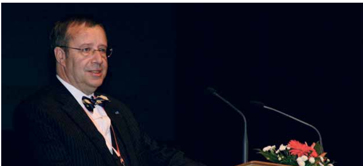
President Toomas Hendrik Ilves Riigiametnike foorumil 7. novembril Tartus

Avalike teenuste arendamisele pühendatud foorumi esimesel päeval toimusid töötod Tartu Ülikooli Kliinikumis, Lõuna Politseiprefektuuris, Lõuna maksu- ja tollikeskuses, Kodijärve Hooldekodus, Riigikohtus, Kaagvere Erikoolis ja mujal. Foorumi teine päev oli pühendatud Eesti Vabariigi juubeliaastale, avaliku teenistuse arenguloole ja tuleviku- väljavaadetele. Juubeliaasta puhul oli foorumit palutud lõpetama president Toomas Hendrik Ilves.