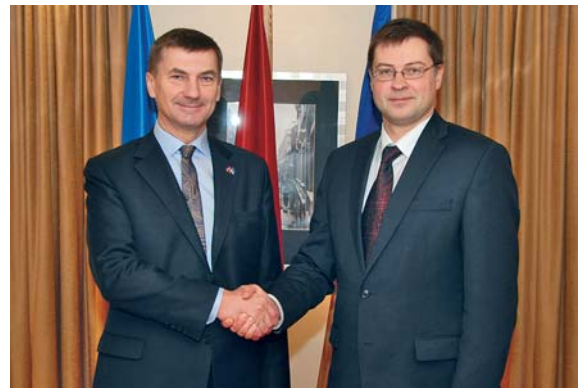
Andrus Ansip ja Valdis Dombrovskis Eesti ja Läti tulevikukoostöö konverentsil Riias 10. detsembril 2010.

verents, kus hinnati erinevaid raportis esitatud soovitusi ja arutati ideid mõlema riigi tulevikukoostööks.