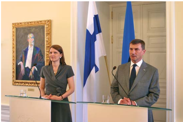
Soome peaminister Mari Kiviniemi ja Andrus Ansip Stenbocki maja Riigivanemate saalis 30. juunil 2010.