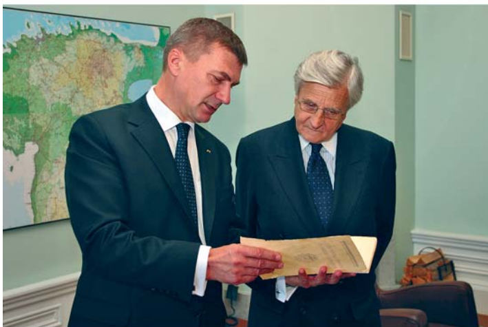
Peaminister Andrus Ansip ja Euroopa Keskpanga president Jean-Claude Trichet Stenbocki majas 20. septembril 2010.