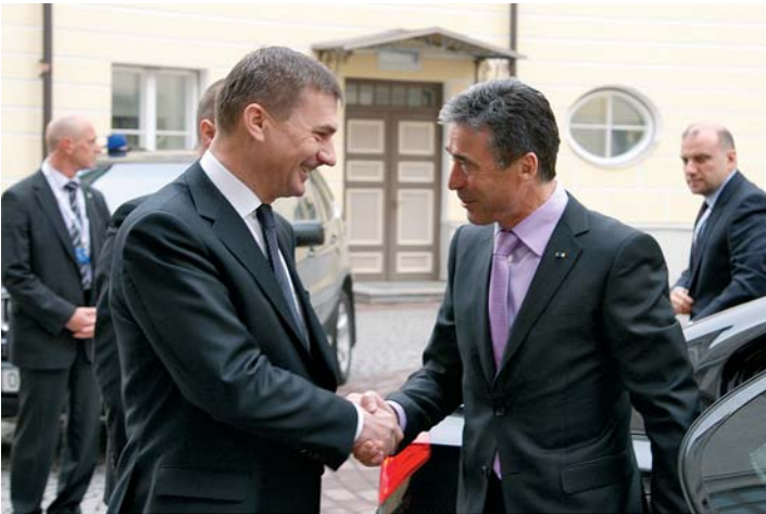
Peaminister Andrus Ansip ja NATO peasekretär Anders Fogh Rasmussen Stenbocki maja hoovis 22. aprillil 2010 seoses Tallinnas 22. ja 23. aprillil toimunud NATO välisministrite kohtumisega.