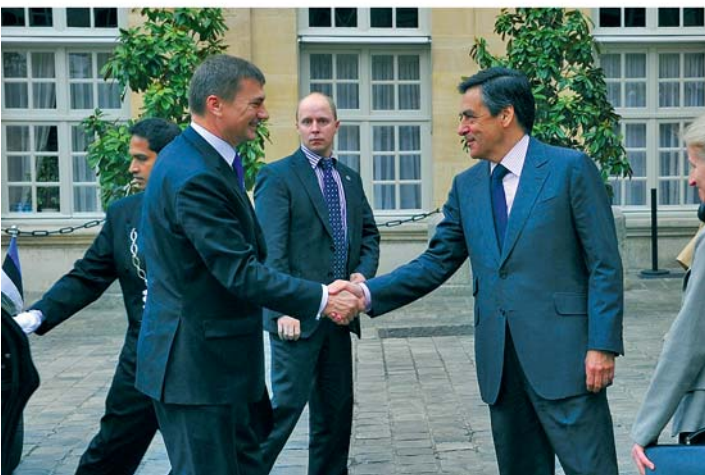
Peaminister Andrus Ansip kohtumisel Prantsusmaa peaministri Francois Fillon'ga Pariisis 25. mail 2010.