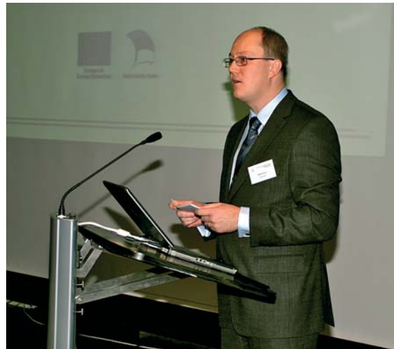
Riigisekretär Heiki Loot avaliku teenistuse tippjuhtide konverentsi „Vähemaga paremini“ avamisel 15. oktoobril 2010.

Detsembrikuus alustas õppetööd teine tippjuhtide järelkasvuprogrammi grupp.