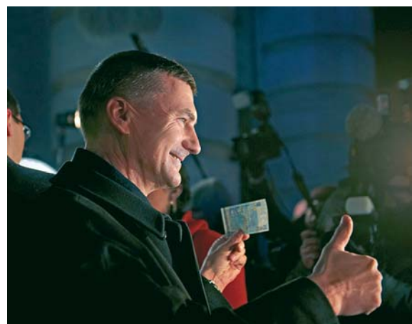
Peaminister Andrus Ansip 1. jaanuaril 2011 pärast esimeste eurode pangaautomaadist väljavõtmist.

2010. aasta oli ka Eesti Euroopa Liidu poliitika 2007–2011 viimane täisaasta ja kokkuvõtete tegemise aeg. Periood oli edukas ja seatud eesmärgid said ellu viidud. Peaminister ütles oma ülevaates valitsuse tegevusest Euroopa Liidu poliitika teostamisel 14. detsembril 2010 Riigikogule: „Meie 2007. aastal sätestatud sihid on saavutatud. Mis peamine, me oleme suutnud end kehtestada Euroopa Liidu tuumikus.“