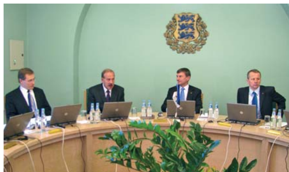
14. jaanuaril 2010 pidas Vabariigi Valitsus väljasõiduistungit Tartus Riigikohtu hoones seoses 90 aasta möödumisega Riigikohtu esimesest istungist.

inimese võrra miinuses. Saavutamata jäänud eesmärgid olid valdavalt seotud oodatust väiksemate rahaliste võimlustega.