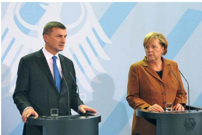
Peaminister Andrus Ansip ja Saksamaa liidukantsler Angela Merkel Berliinis 21. oktoobril 2010.