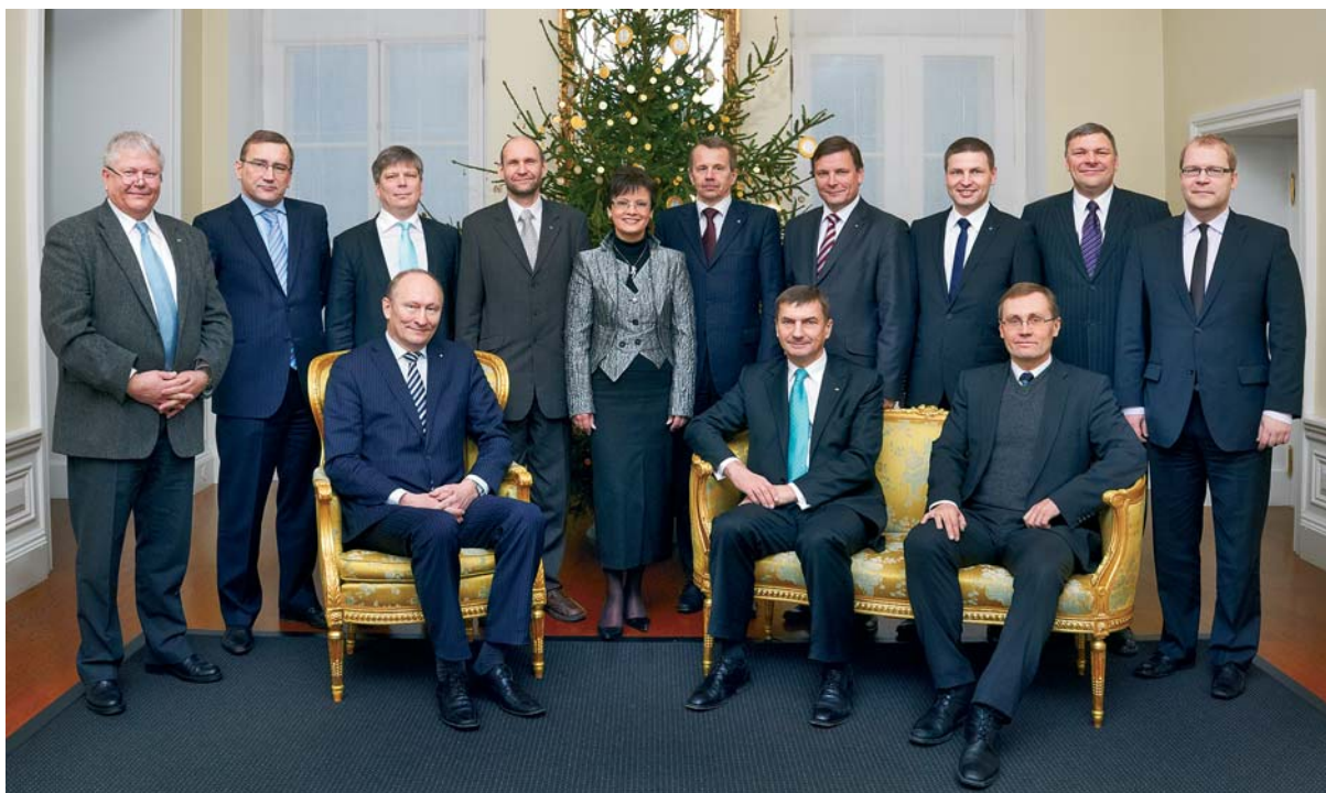
Vabariigi Valitsuse liikmed Stenbocki majas 23. detsembril 2010.

Eesti osakaal 2010. aastal Kyoto heitmekvootide müügis maailmas oli avalike andmete põhjal ligikaudu 60 protsenti. See on tunnustus nii meie kvootide müügiga tegelenud inimestele kui ka ministeeriumide koostöös ettevalmistatud meetmete kvaliteedile.