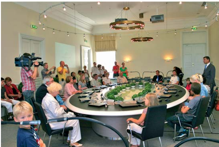
Lahtiste uste päev Stenbocki majas 6. augustil 2010. Valitsusel ja Riigikantseleil möödus 10 aastat Stenbocki majja asumisest.