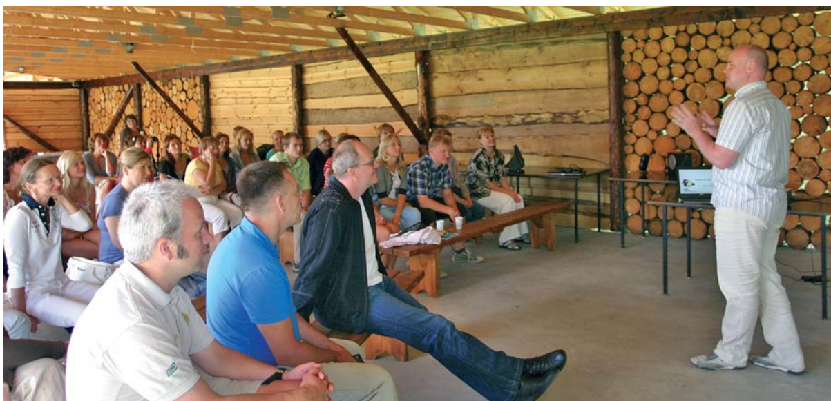
Riigikantselei töötajad suvisel seminaril Kata külas 30. juulil 2010.

Eesti Euroopa Liidu suunalise personalitöö tõhusamaks koordineerimiseks loodi Eesti alalise esinduse juurde Euroopa Liidus alates septembrist 2010 personalipoliitika koordineerimisega tegeleva nõuniku ametikoht ning lähetati Euroopa Liidu sekretariaadist sinna rotatsiooni korras ametnik.