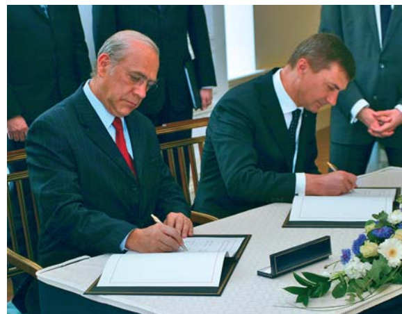
Peaminister Andrus Ansip ja OECD peasekretär Angel Gurría Eesti OECD-ga ühinemislepingu allkirjastamisel Stenbocki majas 3. juunil 2010.

OECD raport antakse välja ingliskeelse trükisena 2011. aasta märtsis. Eesti keeles avaldatakse trükis lühendatult, kesken- duses peamistele hinnangutele, järeldustele ja soovitudele.