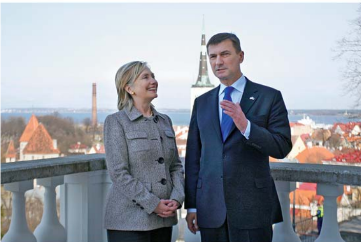
USA välisminister Hillary Clinton ja peaminister Andrus Ansip Stenbocki maja rõdul 23. aprillil 2010.