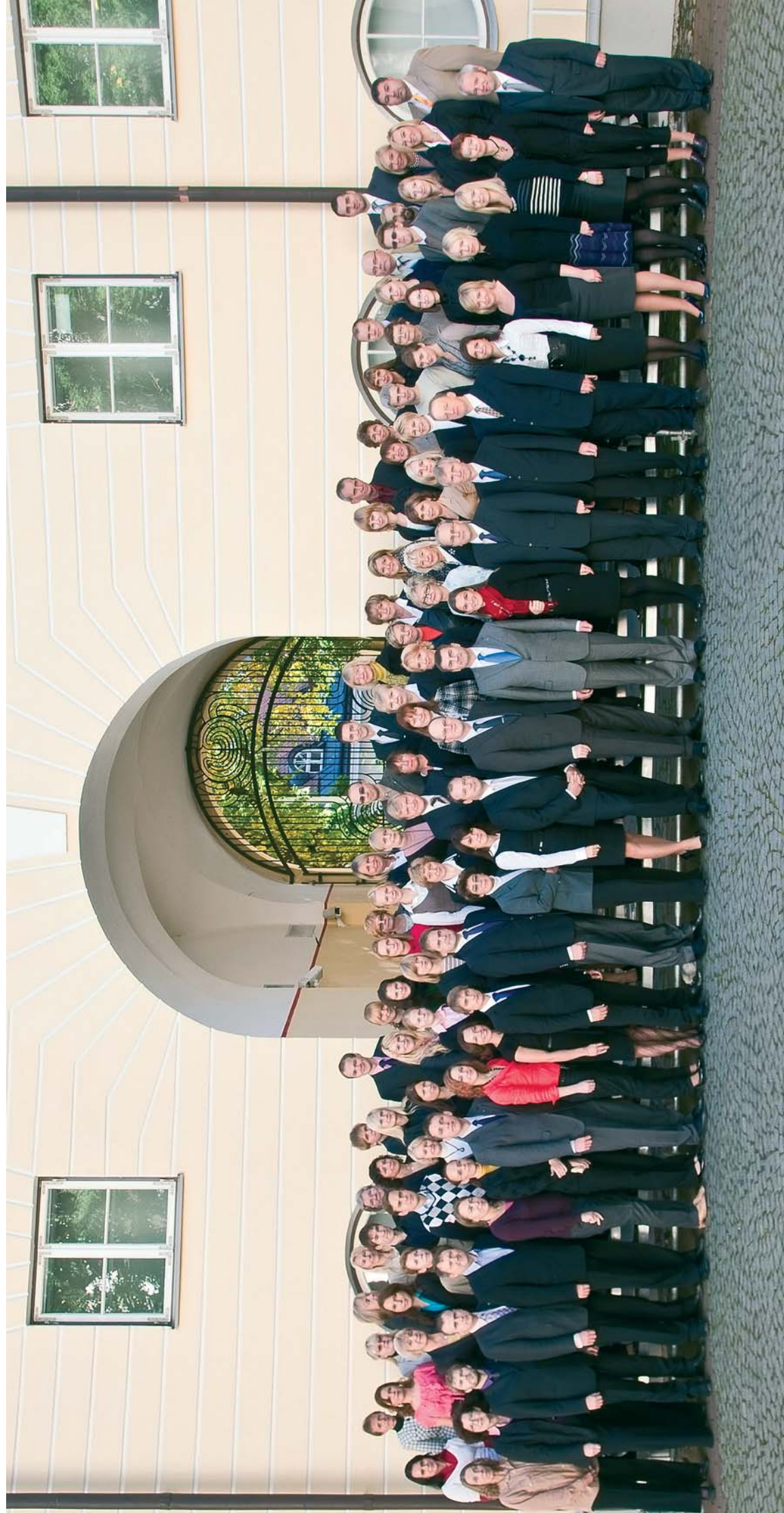
Riigikantselei töötajad koos peaministriga Stenbocki maja hoovis 30. septembril 2010.